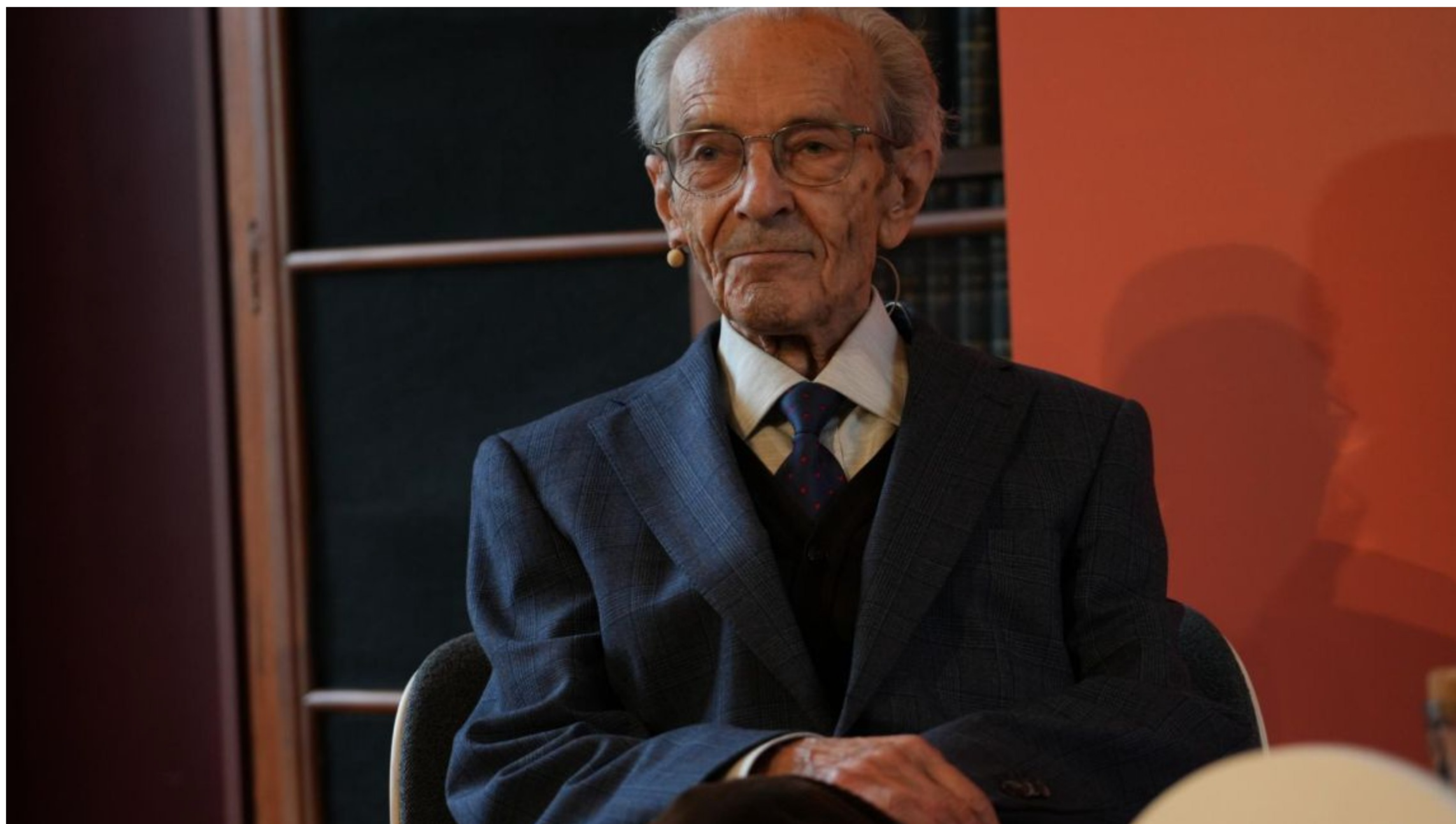
El filòsof Pere Lluís Font guanyador del 57è Premi d'Honor de les Lletres Catalanes