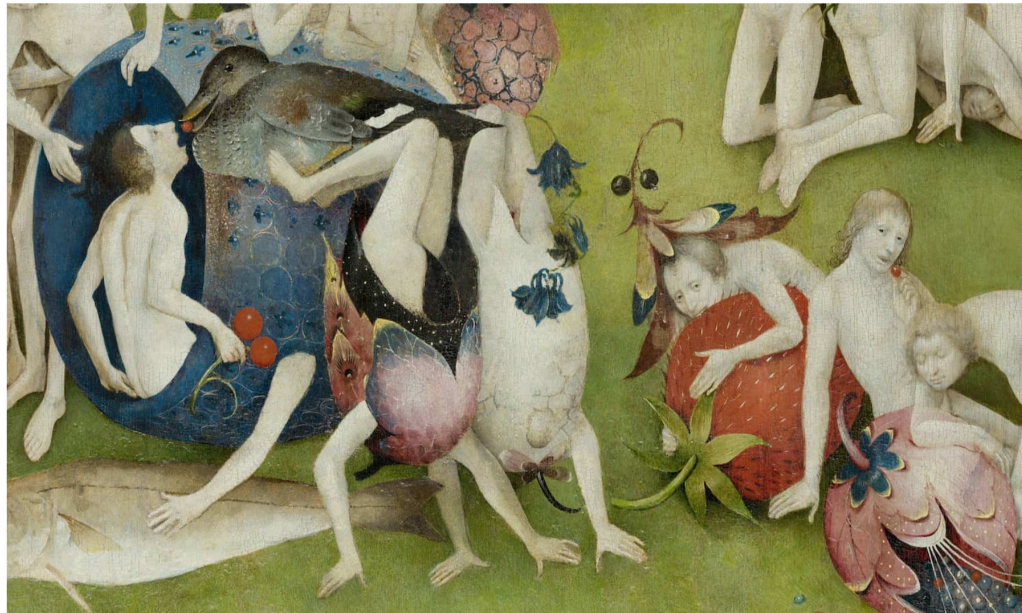
Detall d'El jardí de les delícies de Hieronymus Bosch.

Enllà de desenterrar-la de la història i de situar-la en un marc religiós general, em vaig demanar si a hores d'ara encara podem parlar de la gola com d'un pecat o si, per contra, ens hauríem de referir a una malaltia global. Qui sap, em deia, si no hem d'apuntar a tot un programa de domesticació social: el capitalisme ha fet bona la dita catalana «A la taula d'en Bernat, qui no hi és no hi és comptat». La premissa és que el dispendi ens iguala, socialment i estètica, i de vegades és veritat i d'altres és una ensarronada. Abaratits i per tant degradats quasi tots els béns de consum, el ciutadà s'ha botit de productes alimentaris de baixa estofa, de tecnologia tercermundista i de mil i una formes de lleure adotzenat. La conseqüència és una voracitat rampant que ja ha perdut la mesura «real» de les coses. Tant és si parlem de viatges de baix cost, de mariscades infectes a un preu potable o de préstecs instantanis al 22 per cent. El miratge és que, més o menys, tots i totes tindrem un accés raonable a una mica de tot. I així, mentrestant, no se'ns acudirà que un altre món és possible, o ecològicament improrrogable.