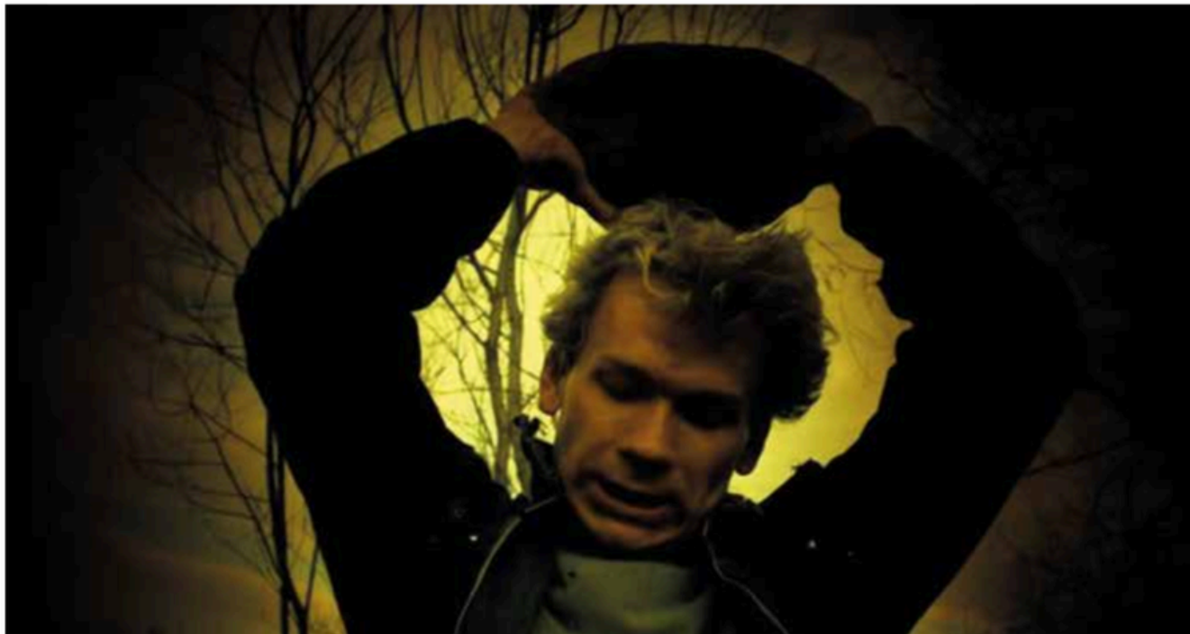
Miroslaw Baka al cinquè capítol de la sèrie Dekalog filmat pel cineasta Krzysztof Kieślowski (1989)

Creador i la humanitat. La diferència ontològica és vinculant i generadora de desequilibris i interpretacions històriques.