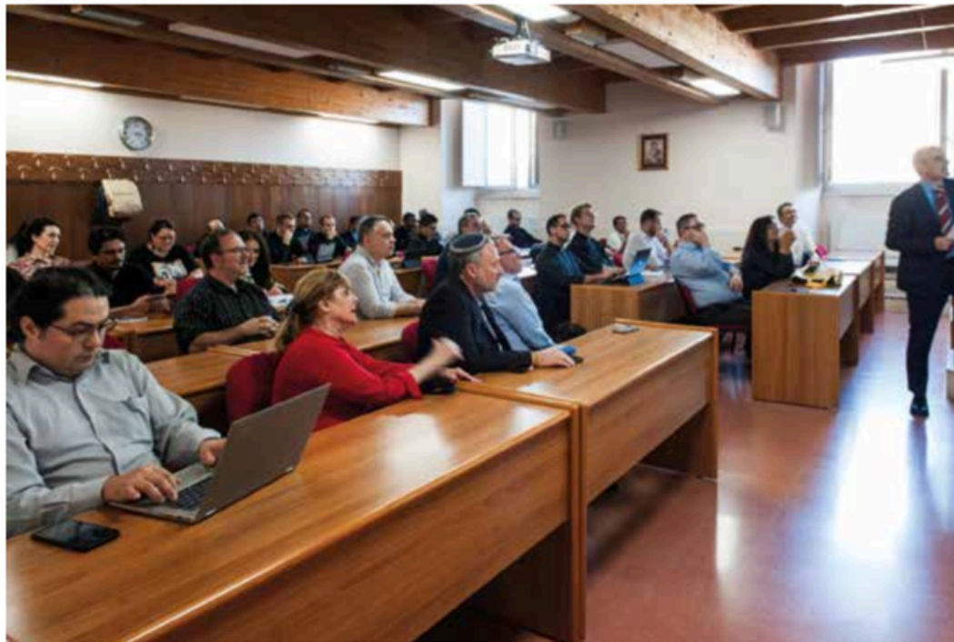
Curs sobre el Decàleg aquest octubre que ha unit jueus i catòlics a la Pontifícia Universitat de la Santa Creu.